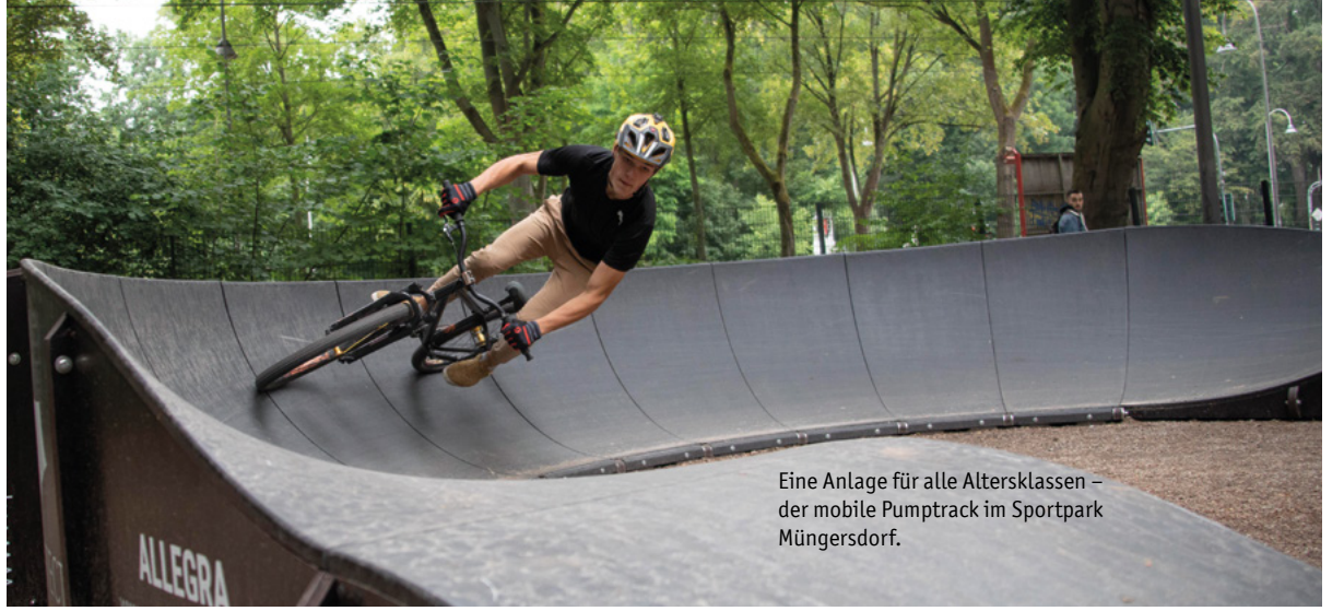
Eine Anlage für alle Altersklassen – der mobile Pumptrack im Sportpark Müngersdorf.